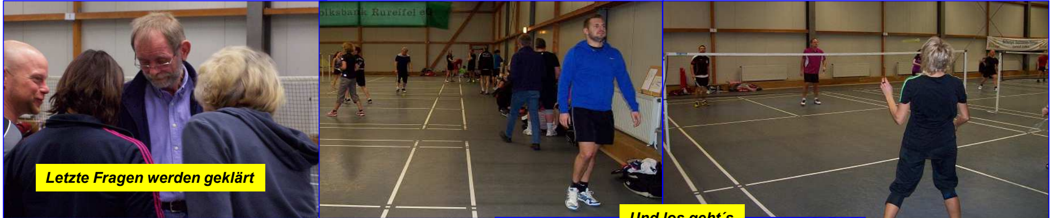
Letzte Fragen werden geklärt